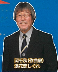
往年の歌手 友情公演